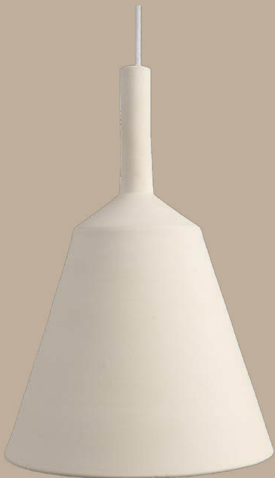
Ànec lámpara colgante