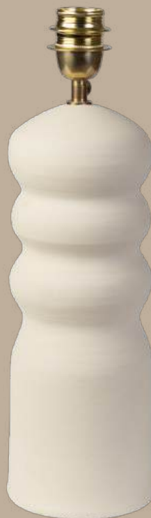
Sarganella pie de lámpara M-36x13 cm S-30x12 cm