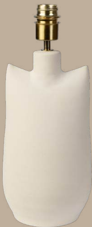
Ventós pie de lámpara M-34x19 cm S-28x18 cm