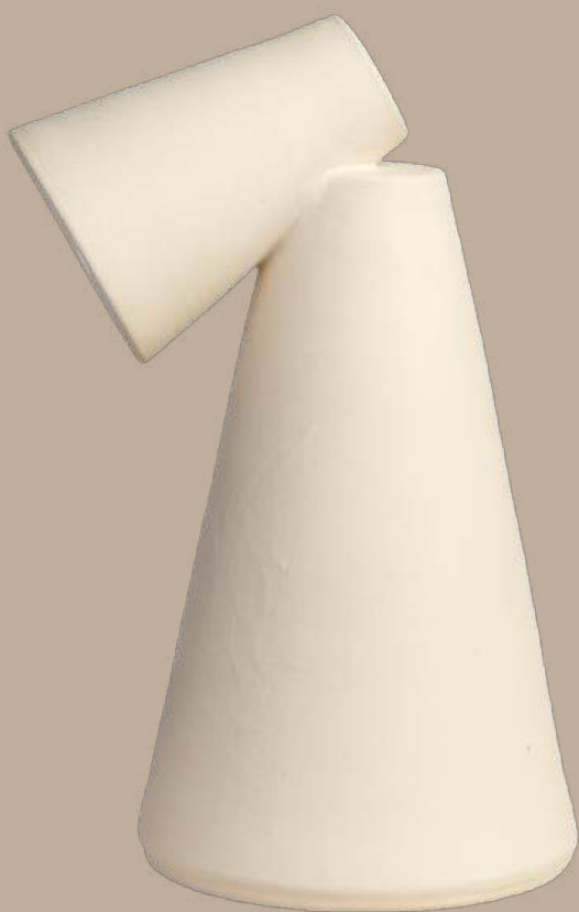
Ànec lámpara sobremesa grande 38x18 cm