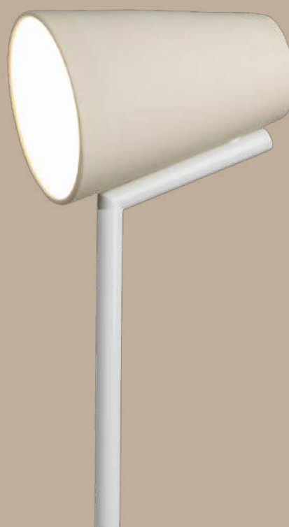
Ànec lámpara de pie