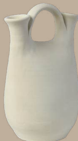
Bursa duo jarrón