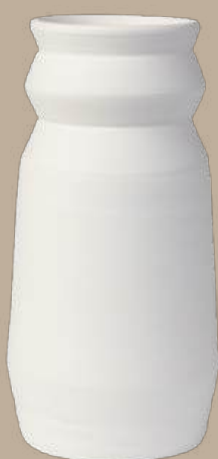
Línea recta 5 jarrón