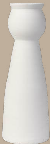
Línea recta 1 jarrón