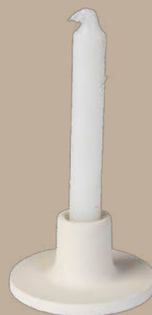
Tabaira portavela 9x4 cm