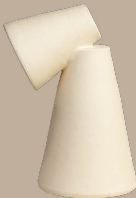
Ànec lámpara sobremesa pequeña 28x16 cm