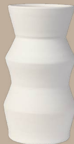
Línea recta 4 jarrón