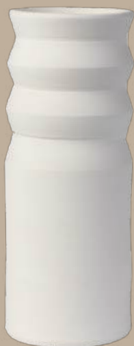
Línea recta 3 jarrón