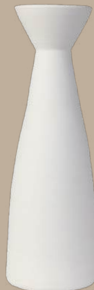
Línea recta 2 jarrón