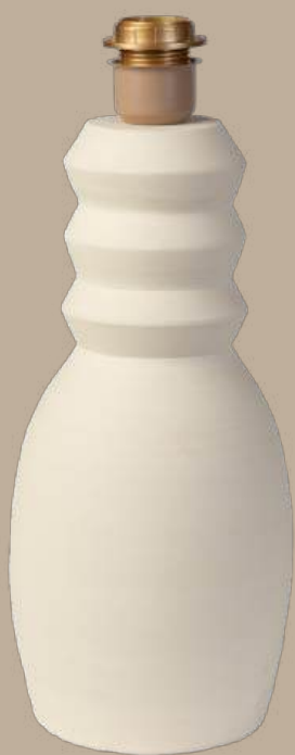
Tarrac pie de lámpara M-35x17 cm S-30x14 cm