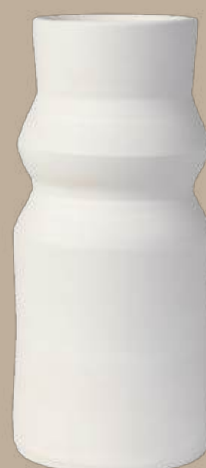
Línea recta 6 jarrón